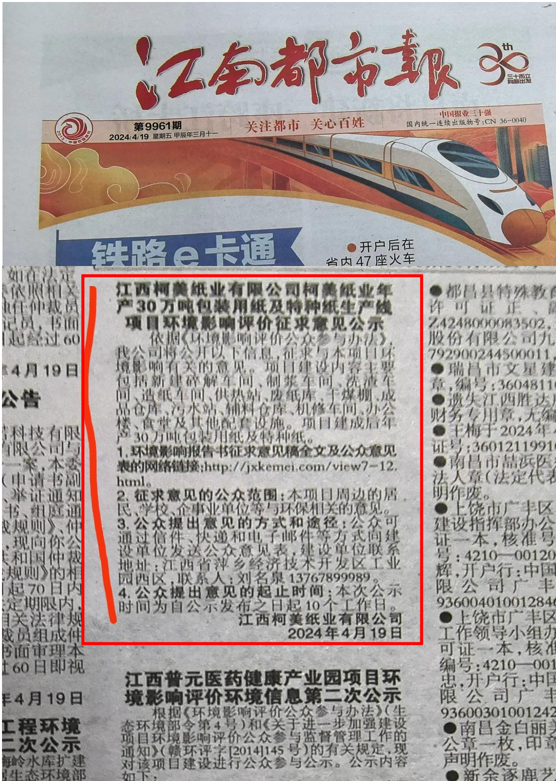
图 2.2-3 报纸第二次信息公示图