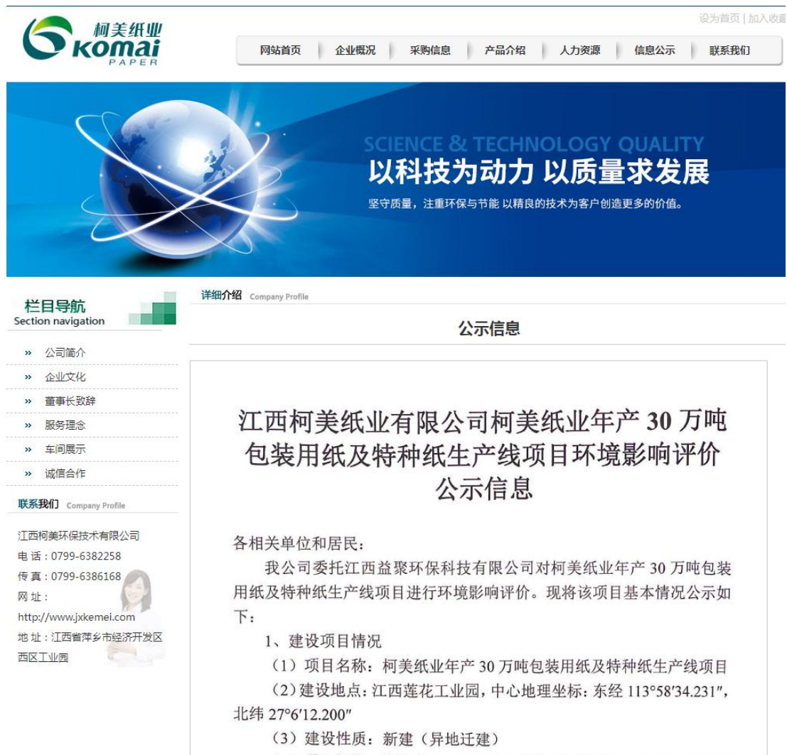
图 2.2-1 项目征求意见稿环境影响评价环境信息公示图

我公司于 2024 年 4 月 15 日在江西柯美纸业有限公司官方网站（公示网址链接： http://jxkemei.com/view7-12.html ）发布了项目征求意见稿环境影响评价信息公示。